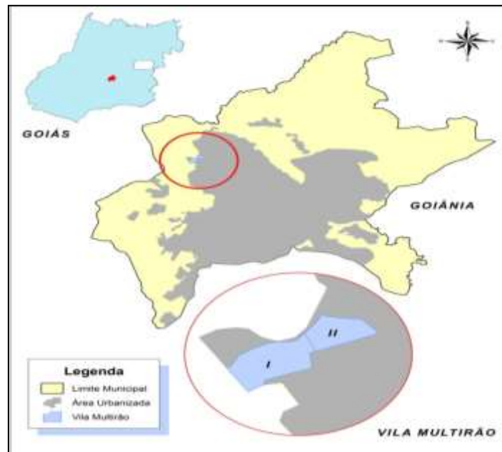
Figura 1. Localização do Bairro Vila Mutirão na cidade de Goiânia-GO.

O bairro Vila Mutirão recebeu esse nome devido a um mutirão para a construção de mil casas em apenas um dia. O então prefeito da cidade, Íris Rezende Machado, convocou moradores cadastrados das áreas invadidas, além da população de modo geral, para juntos construírem mil casas em um só dia (FREITAS, 2007).