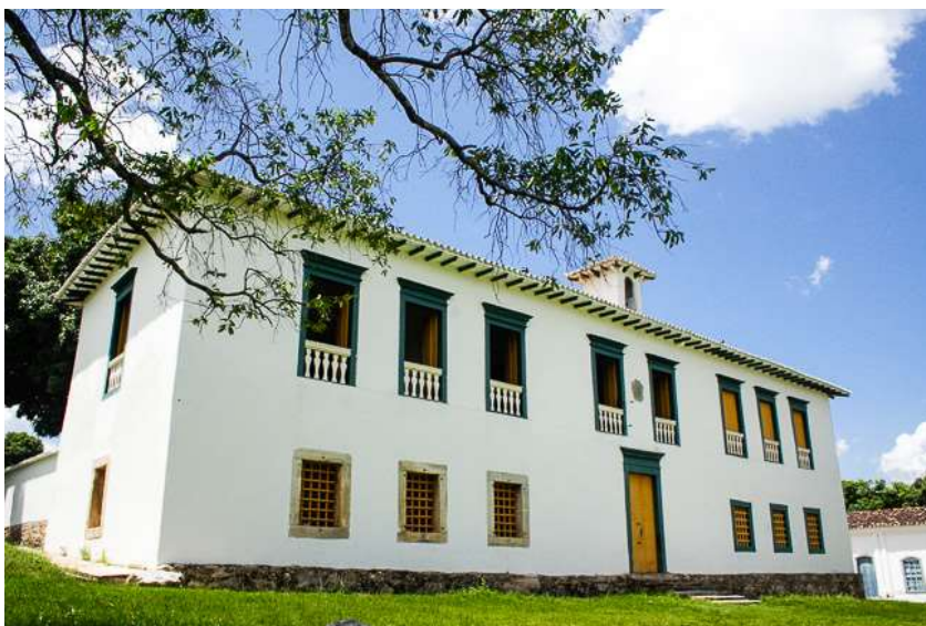
Figura 4 – Planta baixa da Casa de Câmara e Cadeia/ Museu das Bandeiras

A Casa de Câmara e Cadeia funciona como museu aberto às visitas, e é propriedade do Instituto do Patrimônio Histórico e Artístico Nacional (IPHAN).