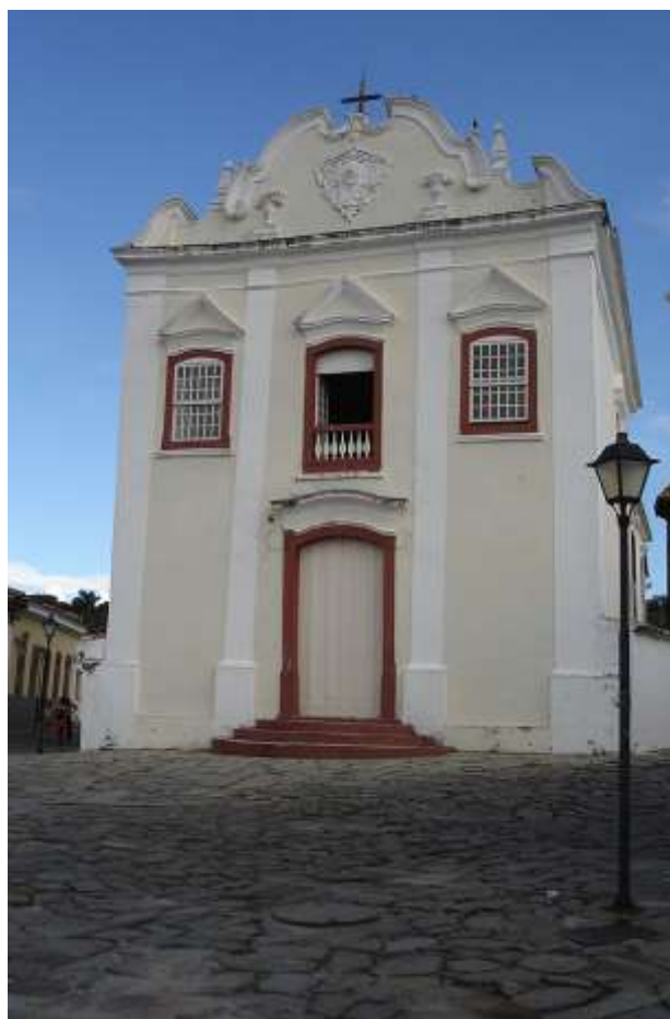
Figura 10 – Museu de Arte Sacra/Igreja Nossa Senhora da Boa Morte