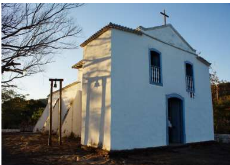
Figura 3 – Igreja de Santa Bárbara

O edifício passou por uma reforma no ano de 2010, onde foram feitas intervenções nos diversos sistemas construtivos. No ano de 2014, uma vistoria foi feita seguida de uma restauração simples, em elementos como a pintura.