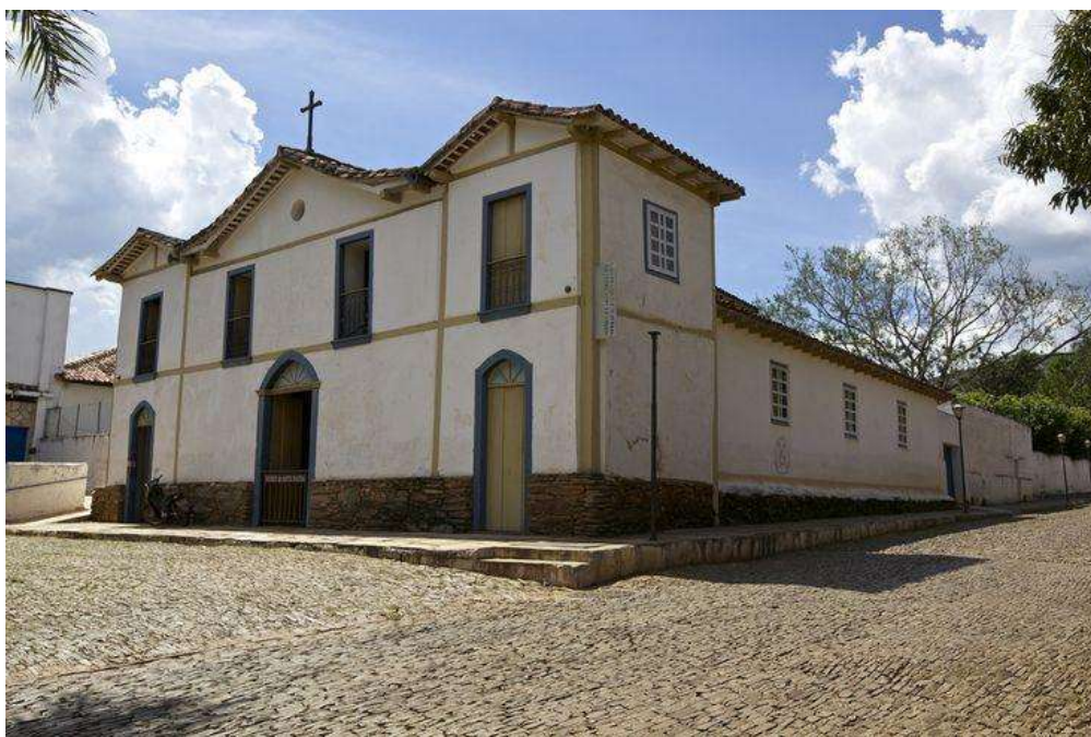
Figura 7 – Igreja Nossa Senhora do Carmo