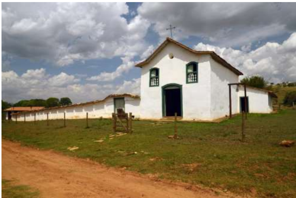
Figura 8 – Igreja de São João Batista do Arraial do Ferreiro