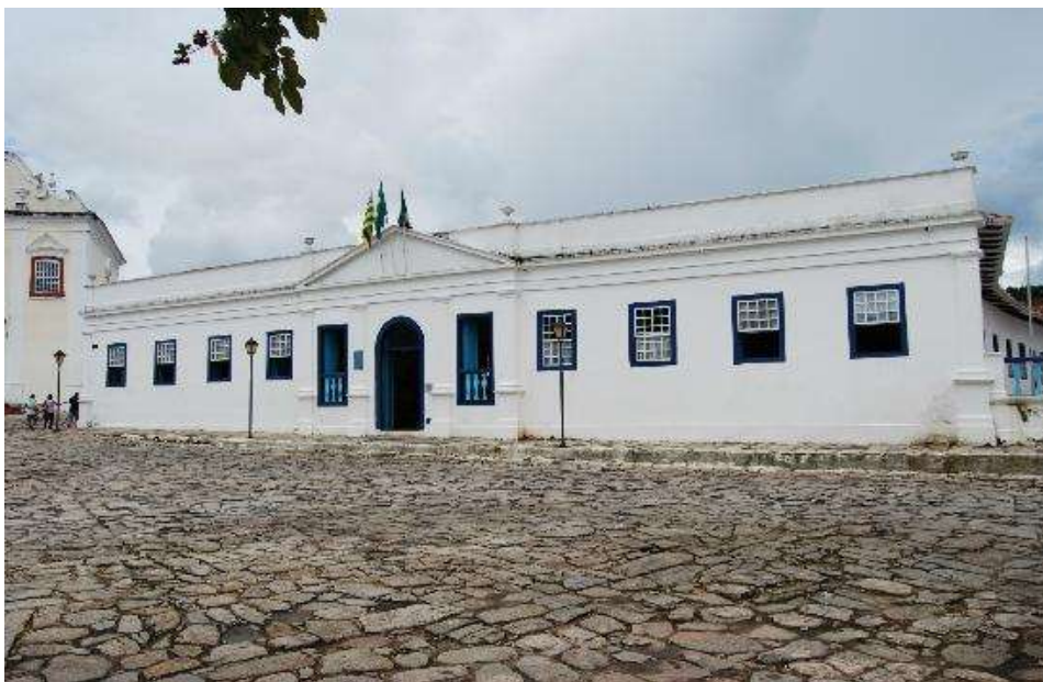
Figura 6 – Palácio Conde dos Arcos