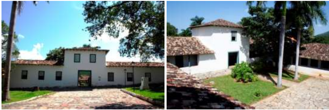
Figura 1 - Quartel dos Dragões/Quartel do XX