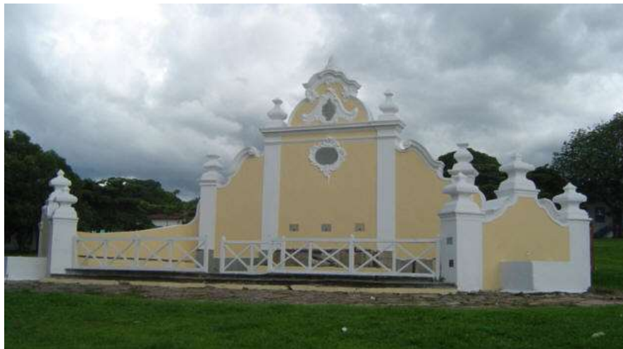
Figura 2 - Vistas frontal do Chafariz de cauda da Boa Morte

Sua obra envolve técnicas construtivas como alvenaria de pedra, com detalhes em pedra sabão e pintura à caiação. Sua última reforma aconteceu em 2012, após um ato de vandalismo contra o monumento. Porém, ele passa anualmente por restaurações na pintura.