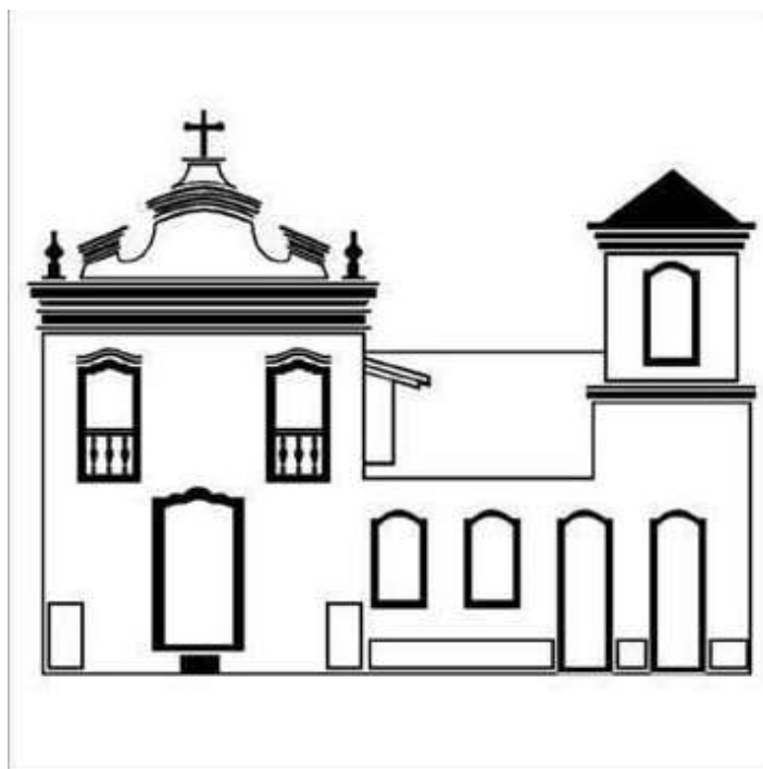
Figura 9 – Fachada da Igreja Nossa Senhora da Abadia